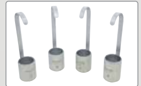
Elcometer 2434, 2435, 2436, 2437 Frikmar- Viskositätstau-becher