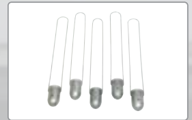
Elcometer 2210 Zahn-Viskositätstau-becher