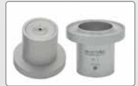
Elcometer 2350, 2351, 2352, 2353, 2354 Viskositätsauslaufbecher