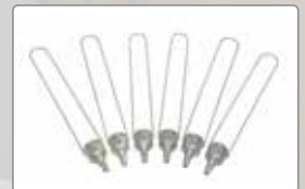
Elcometer 2310 Shell- Viskositätstau-becher